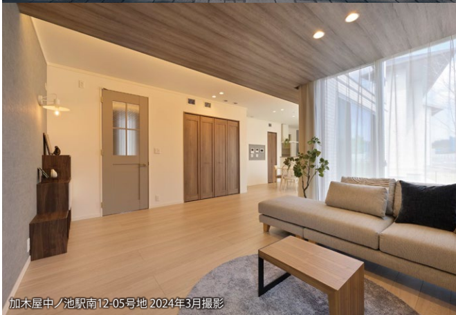
加木屋中ノ池駅南12-05号地 2024年3月撮影