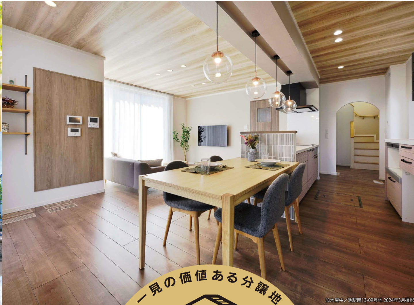
加木屋中ノ池駅南13-09号地 2024年3月撮影